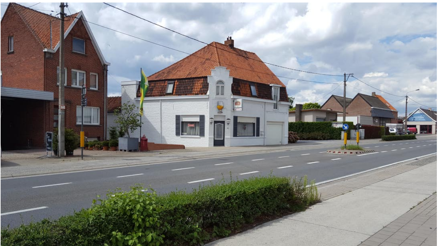
Situatie in 2017