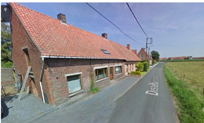
Distelbosstraat 26

De kledij van de soldaten van de jagers te voet bestond uit een groene tuniek met gele bies, daaronder een blauwgrijze broek met groene naad en zonder bies. Als hoofddeksel droegen zij een shako. Als kenteken droegen zij het regimentsnummer..