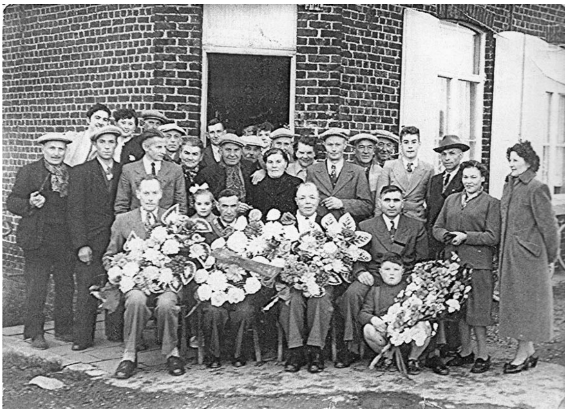
Duivenbond De Boeren van den Transvaal (1958)