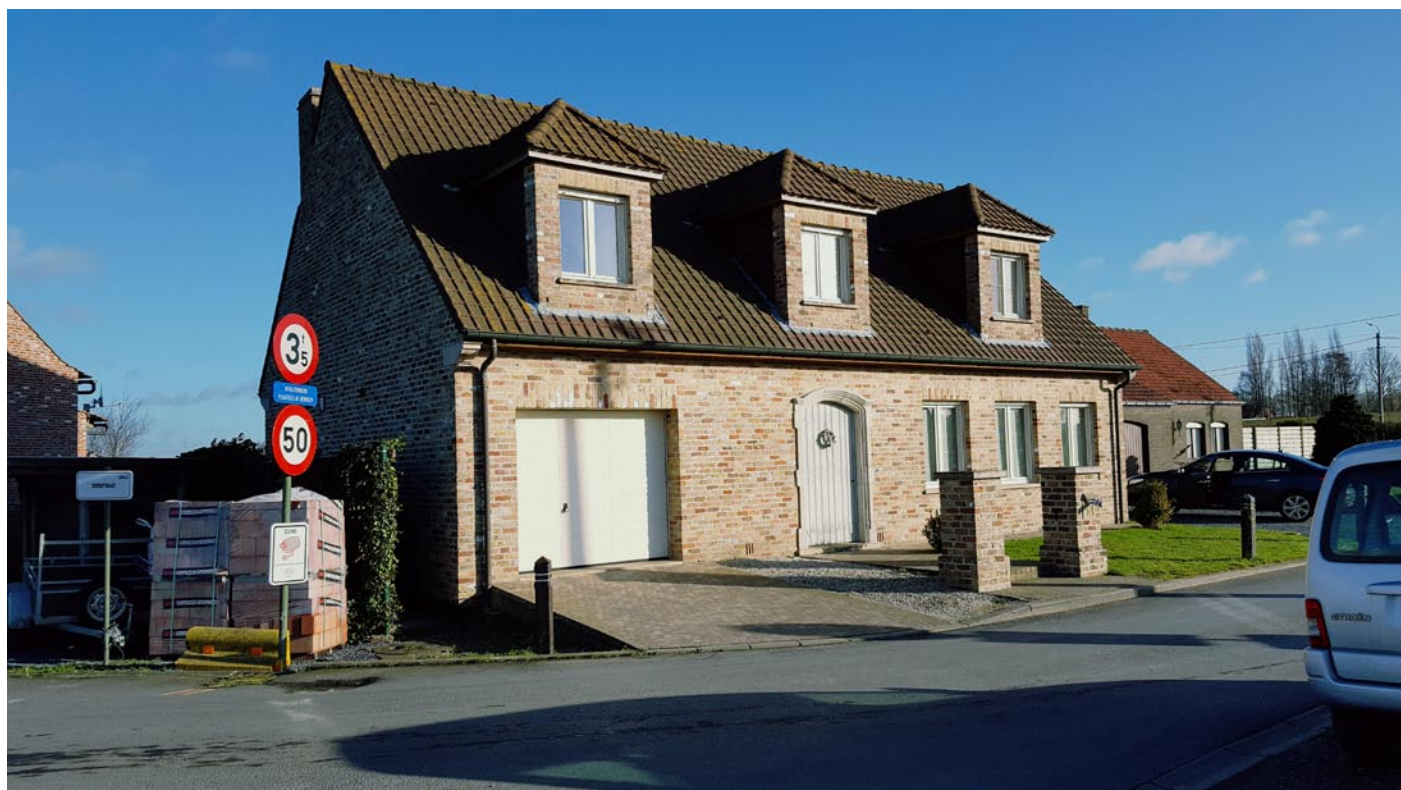
De situatie in 2018