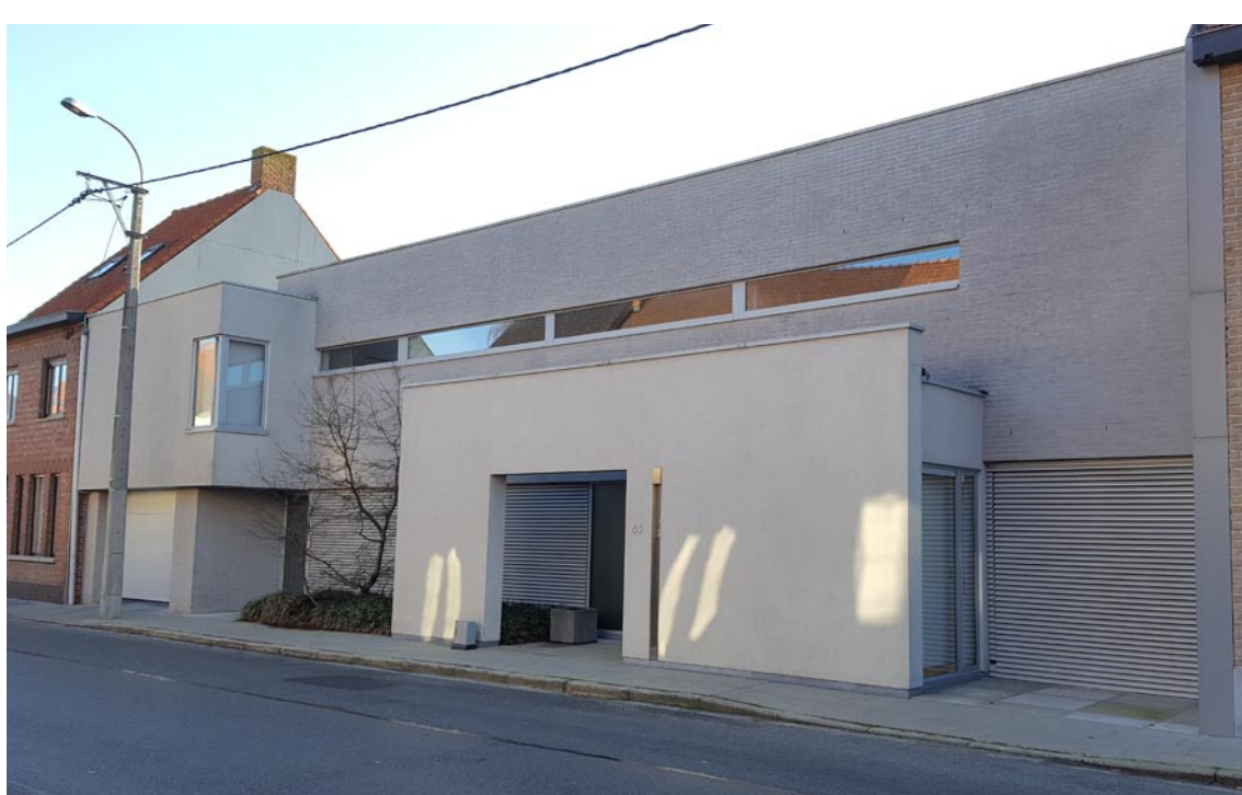
In 't Nieuw Kwartier anno 2018