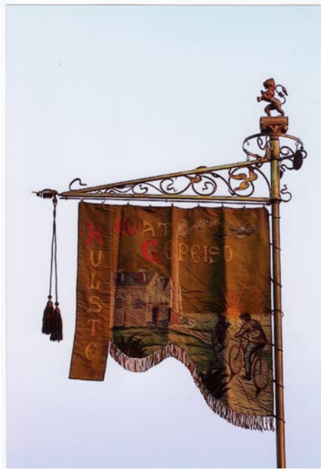
De fameuze banier van beide kanten gezien