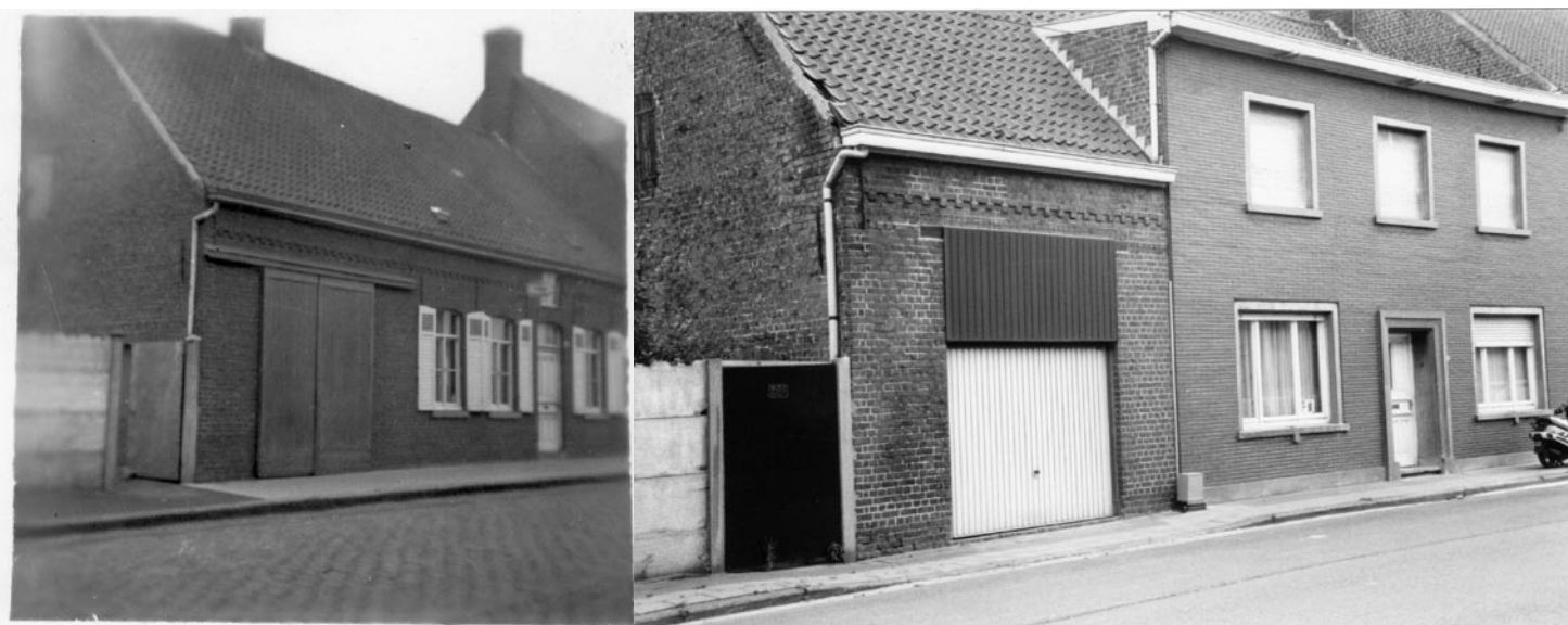
Oude foto's van In 't Nieuw Kwartier