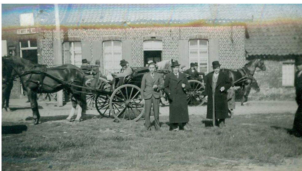
Waarschijnlijk na een of andere optocht poseren hier enkele deelnemers op het graspleintje (nu kleine geasfalteerde parking) vóór 't Peerdeken.