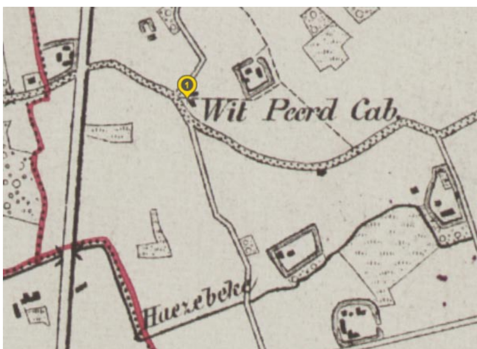
Op de kaart van Vadermaelen uit 1841 zien we 't Wit Peerd Cabaret. Merk ook dat alle hoeven in de buurt nog omwald zijn en de Brugsestraat is aan weerzijden nog omzoomd met een bomenrij.