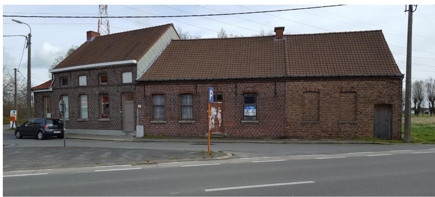
't Wit Peerd - 't Peerdeken (huis links) anno 2017