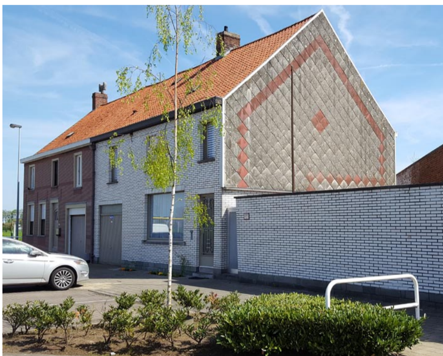
'Klakke Kruyskens' anno 2018