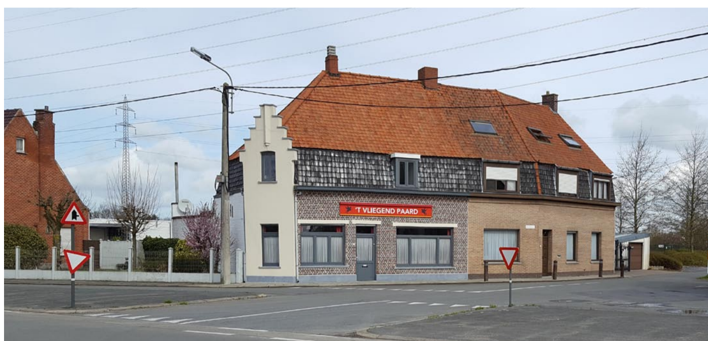
Het Vliegend Paard in 2017