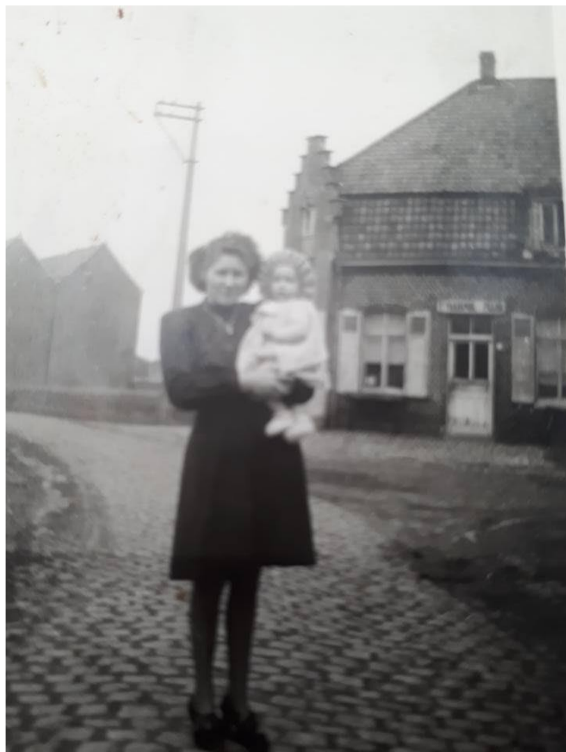
Het Vliegend Paard toen de Brugsestraat nog een kalseideweg was en poseren midden de straat nog kon.