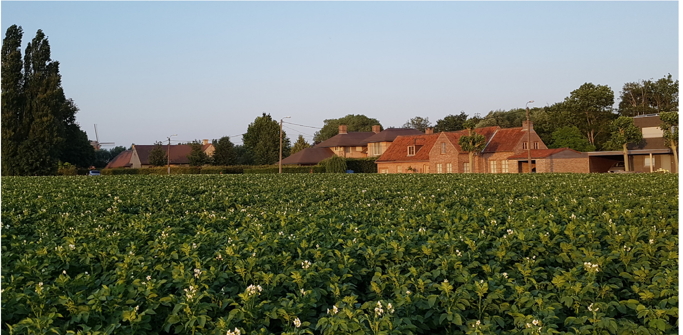
Het Rozeken anno 2019