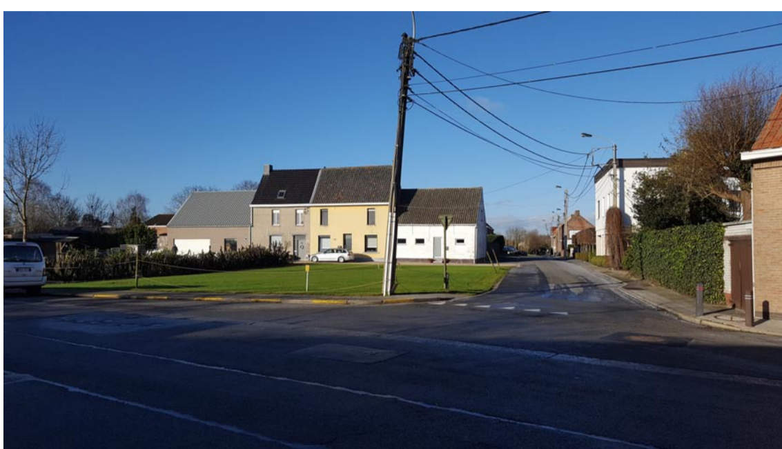
Het Blauwhuis in 2018, het rechtse, lagere deel was vroegere koetshuis, het Siezekot dat tijdens de Eerste Wereldoorlog dienst deed als gevangenis.