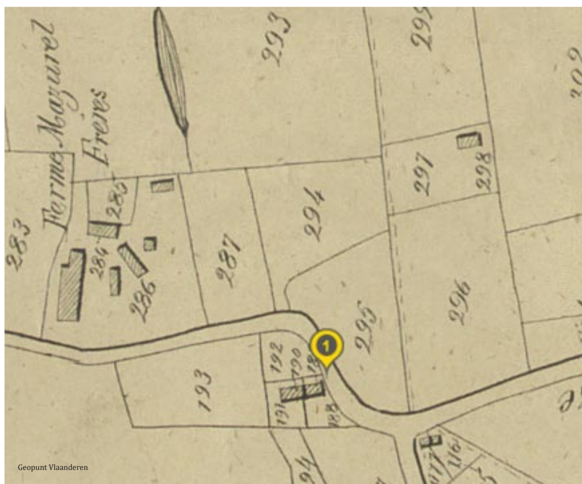
Op de Popp-kaart uit 1856 zie je de toestand vóór de eerste herbergier de woning verbouwd: er staat nog een tweewoonst, met de voorgevels naar het zuiden.