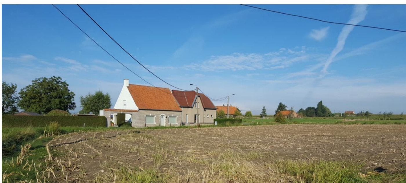
De situatie in 2017