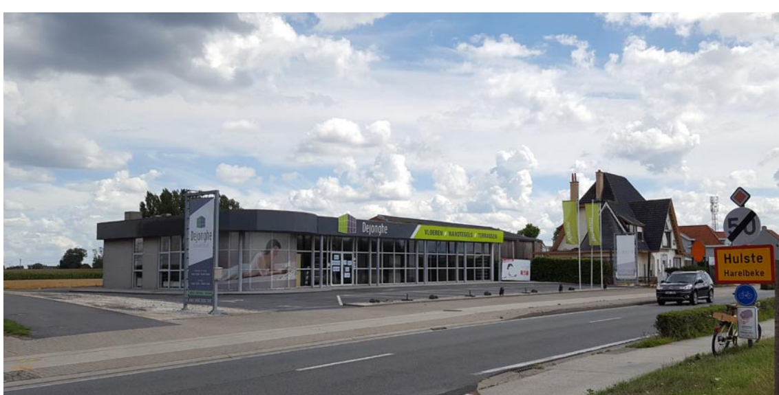
Op de plaats waar vroeger de herberg stond is er nu een tegelbedrijf.