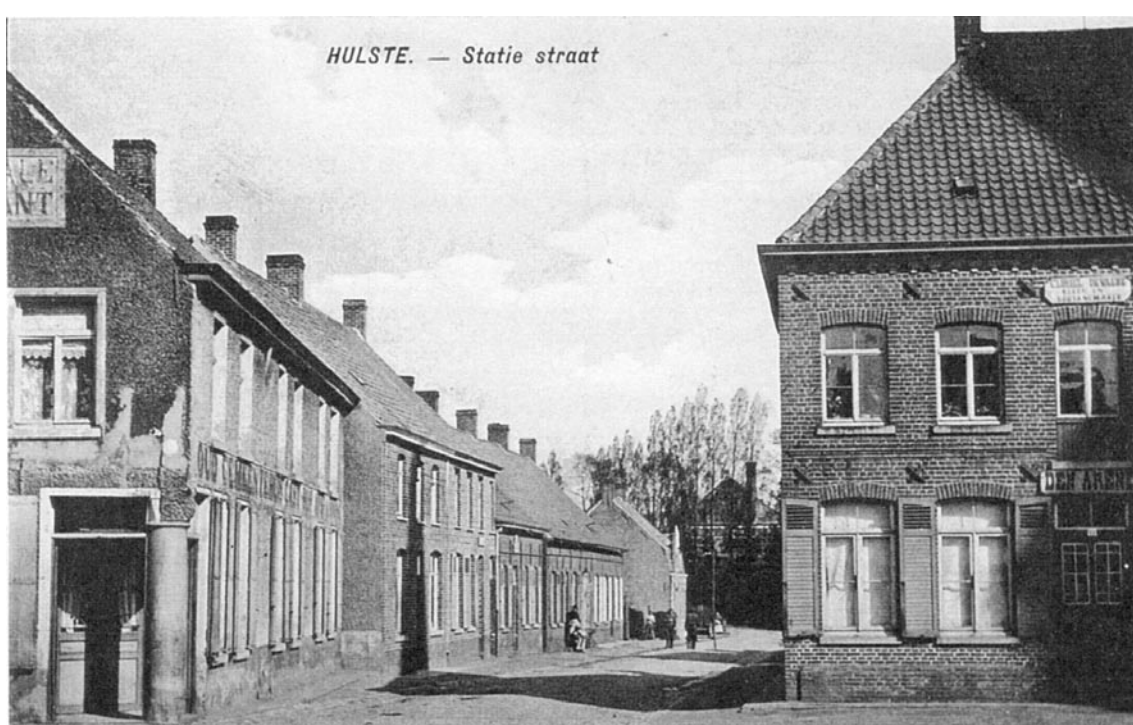
Zicht op de Statiestraat, de huidige Vlietestraat met het vierde huis links Den Barbier/Het Sporthuis