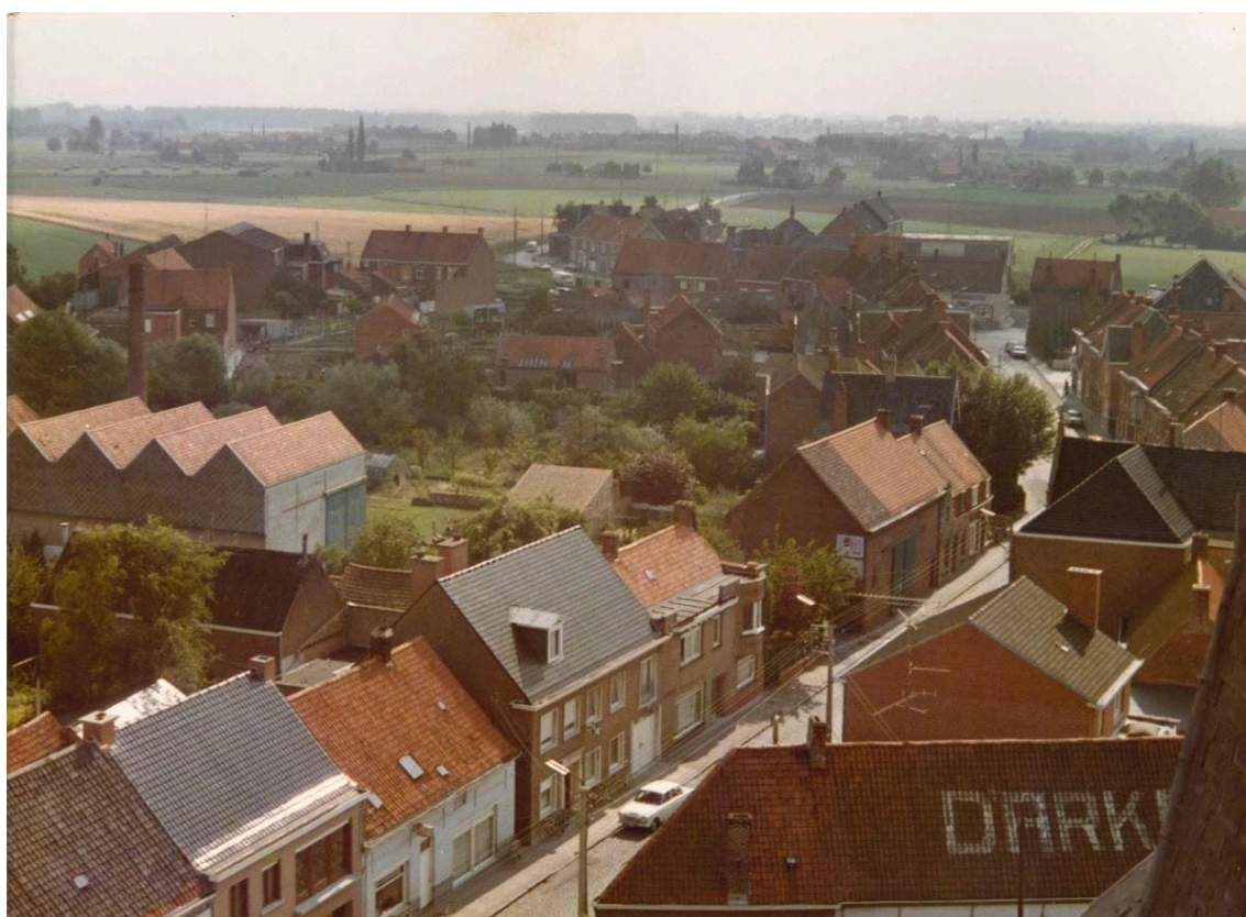
Luchtfoto van de Vlietestraat. Het derde huis links met de rode pannen was ooit Den Barbier/Het Sporthuis