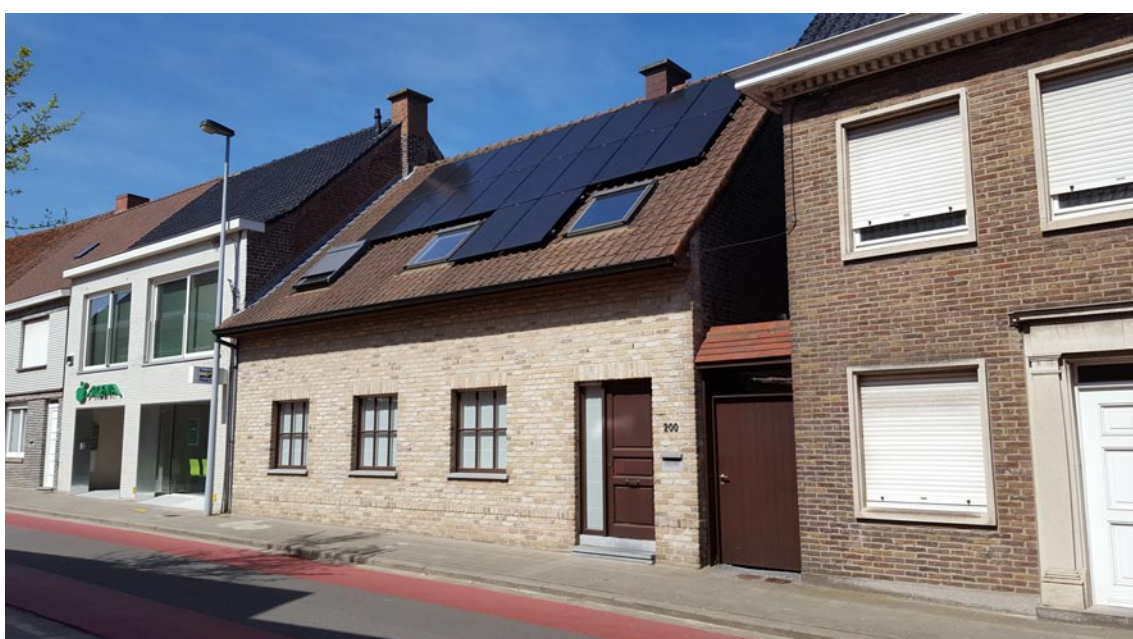
Den Barbier / Het Sporthuis anno 2018