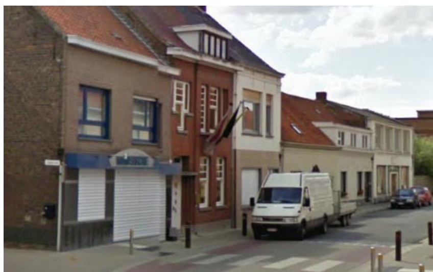
Foto uit 2009 - Uiterst rechts de meubelzaak van Leon en Anaïse Messiaen-Vanassche