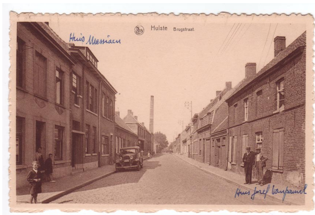
De Vlaamse Leeuw - De Kroone , Het vijfde huis aan de linkerkant