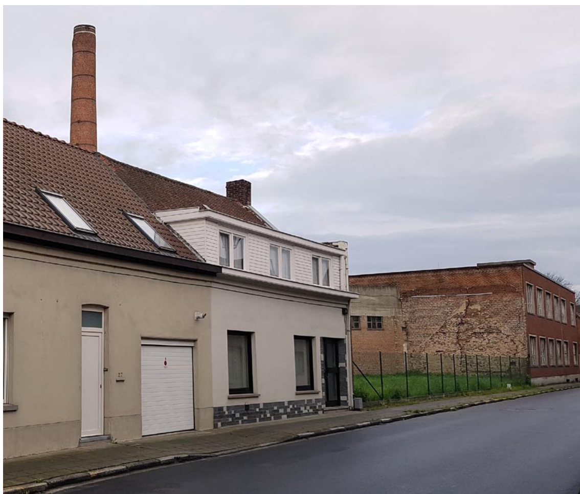
De Vlaamse Leeuw - De Kroone anno 2019