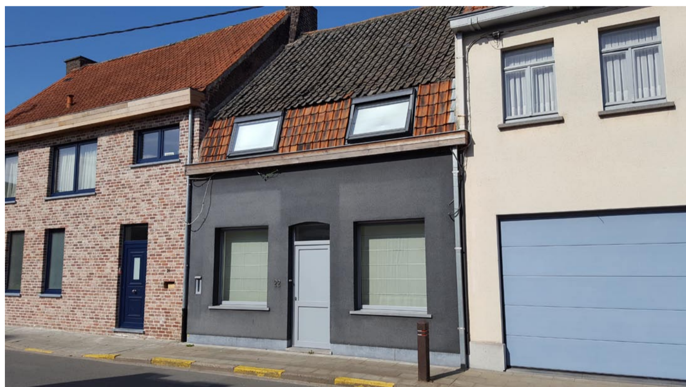
De Trombone, situatie in 2017