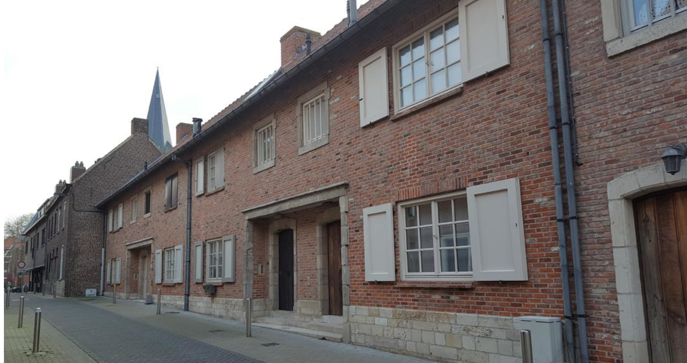
Situatie in 2018