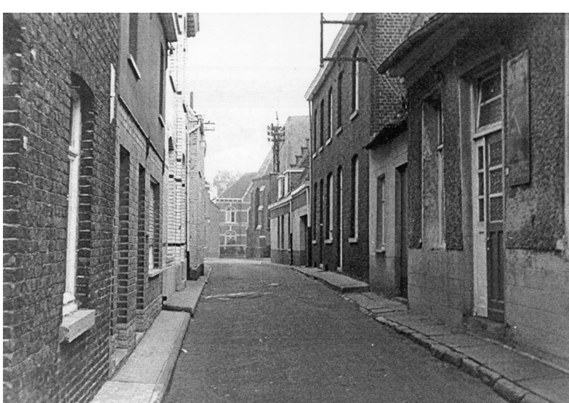
De Tieltsestraat gezien in de richting van Hulstedorp. Rechts vooraan herberg De Sterre .