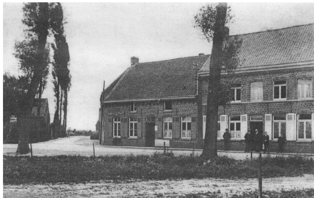
Foto's van tijdens of kort na de Eerste Wereldoorlog