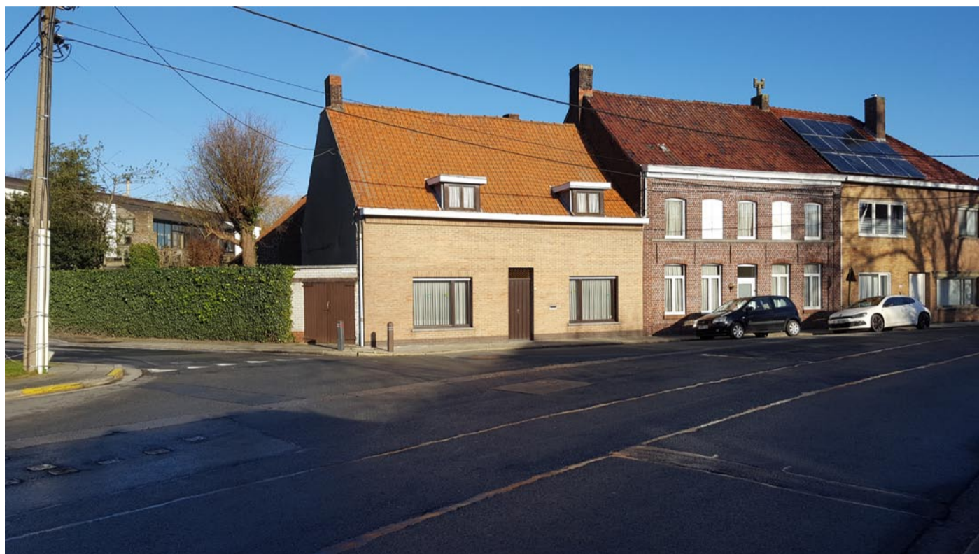
Situatie in 2018