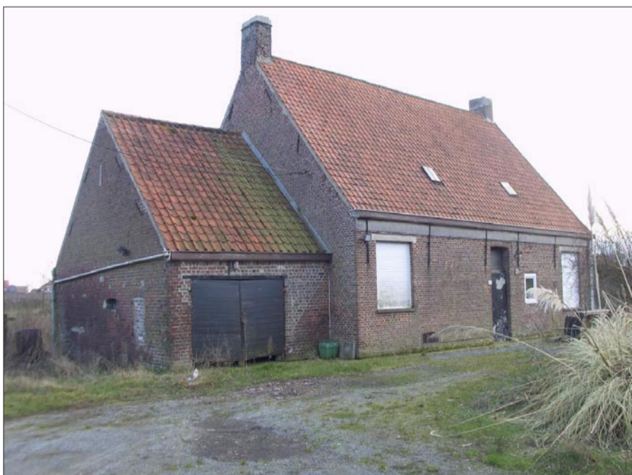
De Reisduif vóór de afbraak