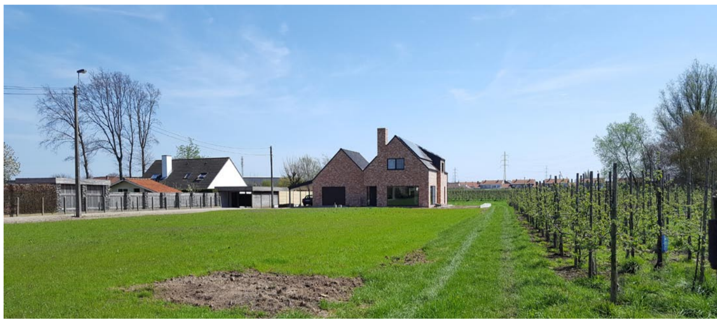
Situatie in 2018