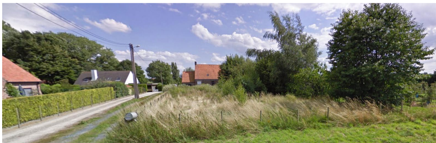
De toestand vóór de afbraak gezien vanaf de Kapelstraat