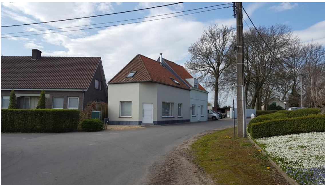
Café De Bakkerij / De Musschen anno 2017