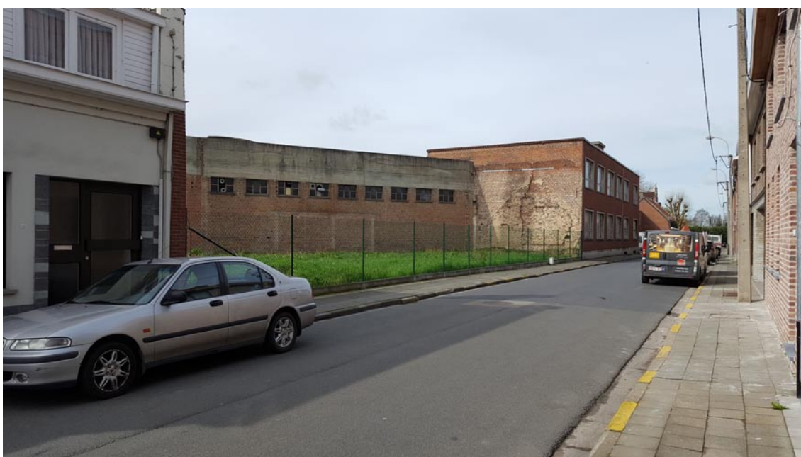
Café De Mandemakerij werd rond 2005 afgebroken