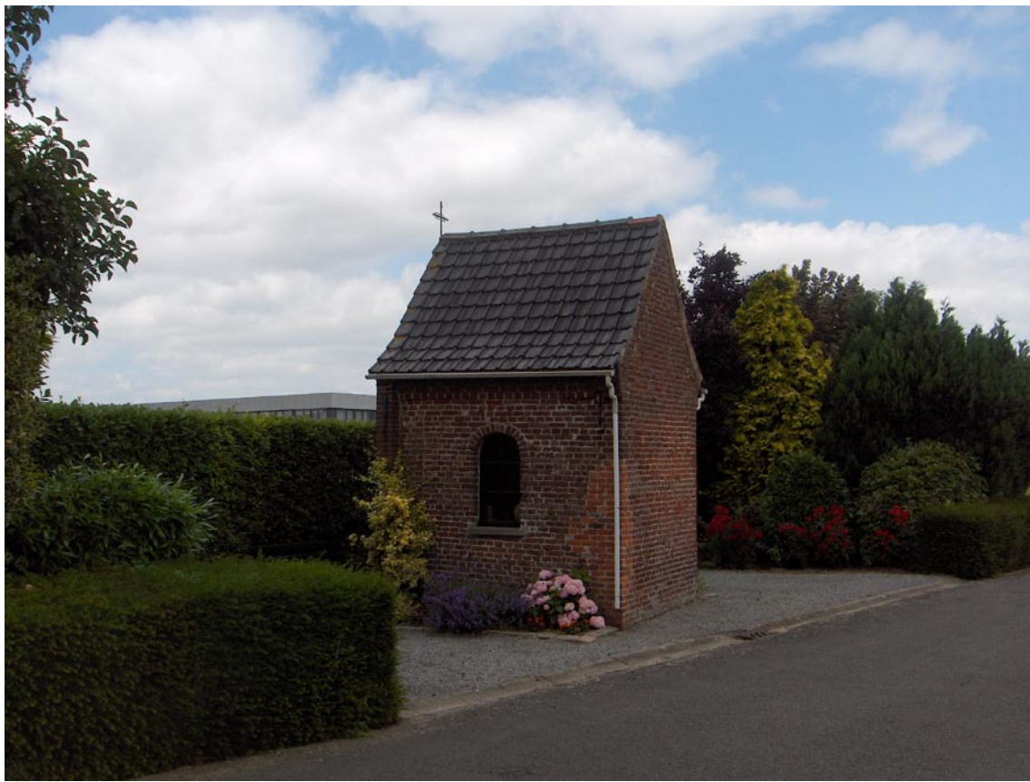
De kapel waarnaar de straat en het café genoemd is. Door de herinrichting en rechttrekking halfweg de 20ste eeuw van de Kapelstraat kwam de kapel met de rug naar de straat te staan.