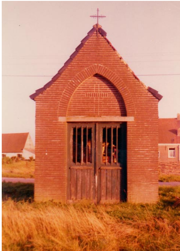
Oude foto van de kapel met café De Reisduif rechts op de achtergrond.