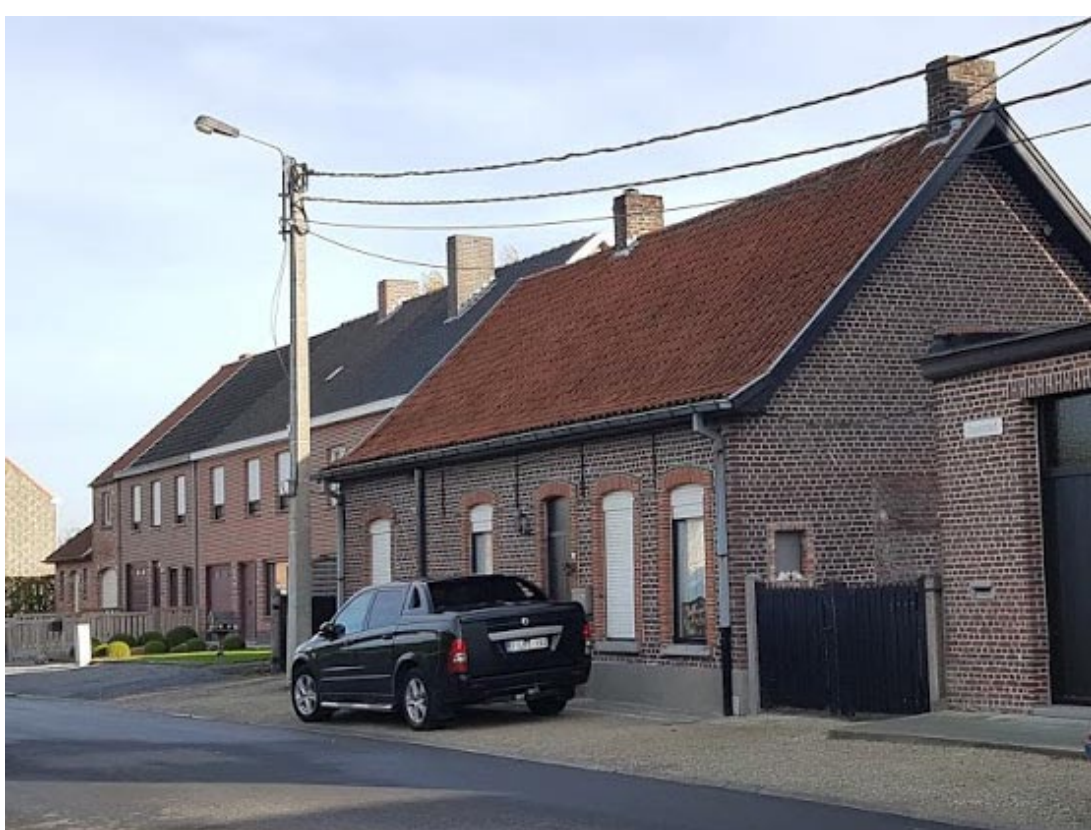
'De Kapelle' in 2018