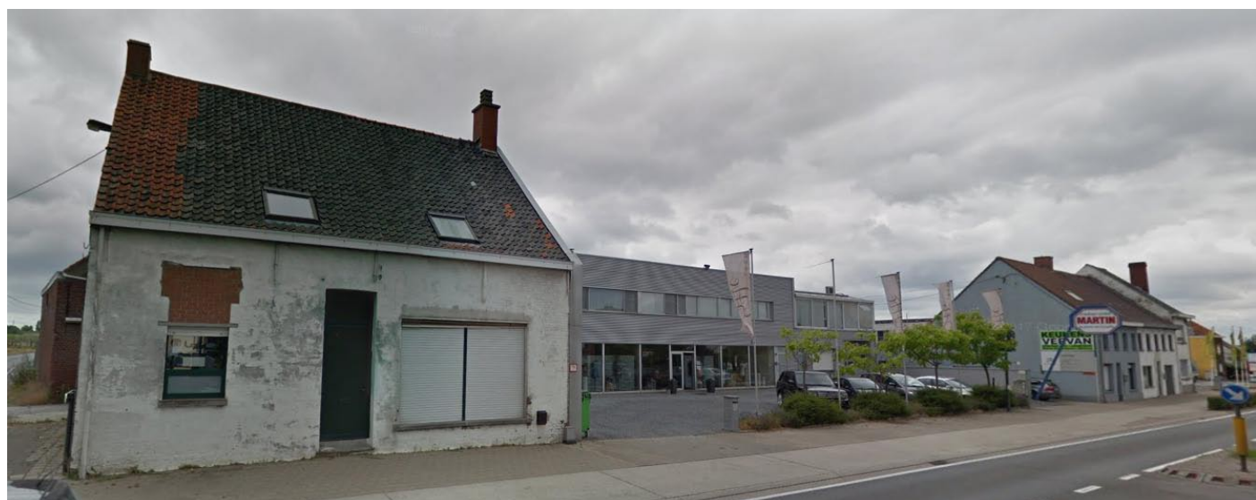
In de plaats van het herenhuis kwam er een kledingwinkel.