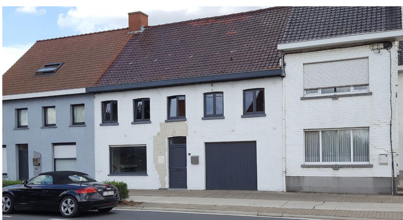
Café De Brouwerij anno 2017

van 1908 tot 1952: Achille Bostoen x Sylvie Verhelle