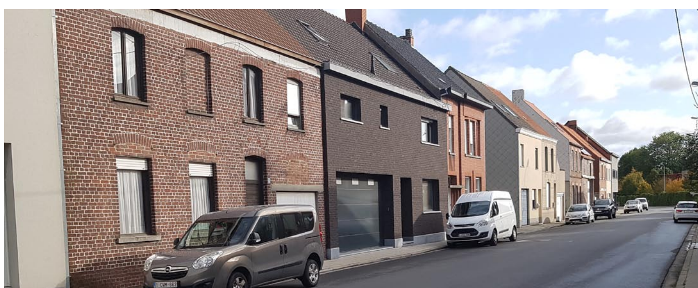
Au Lion d'Or / De Vlaamsche Leeuw . Foto van 2019. Het huis kreeg een nieuwe voorgevel.